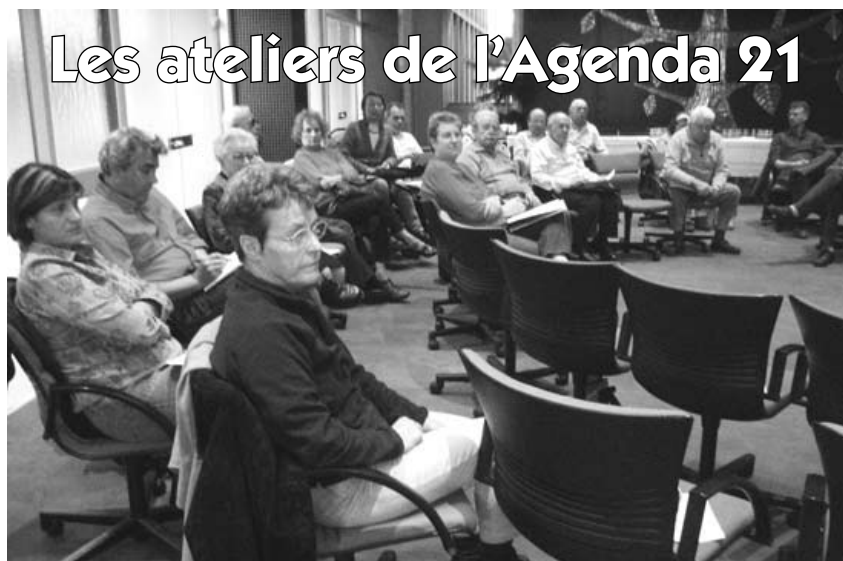
Les ateliers de l'Agenda 21